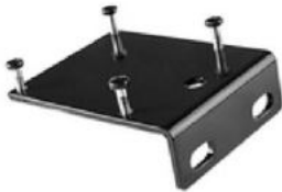
Wandwinkel SKU: 006.90