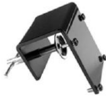
Tischklemme 0-44 mm SKU: 007.90