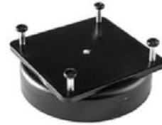
Magnetfuß SKU: 008.90