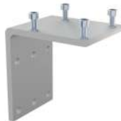
Wandwinkel SKU: 00295