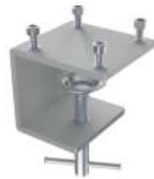
Tischklemme 0-44 mm SKU: 00395