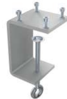
Tischklemme 16-85 mm SKU: 00495