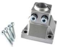
Aufschraubflansch (inkl.) SKU: 00595