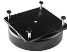
Magnetfuß SKU: 008.90