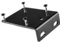
Wandwinkel SKU: 006.90