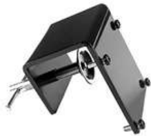
Tischklemme 0-44 mm SKU: 007.90