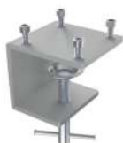
Tischklemme 0-44 mm SKU: 00395