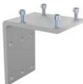
Wandwinkel SKU: 00295